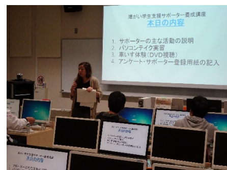
昨年度：養成講座風景